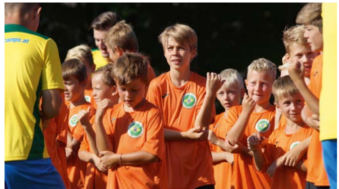
Eltern/Trainerauswahl beim Kick gegen die Seleção und die Kinder beim Morgentanz

An dieser Stelle möchten wir uns nochmals bei allen Unterstützern bedanken, ohne die dieses Camp nicht zu organisieren wäre.