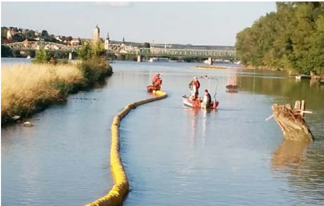
Ausbringen von Ölsperren

Wir möchten uns auf das allerherzlichste bei allen Besuchern unseres Feuerwehrfestes bedanken. Der Dank gilt auch allen Helfern und Gönnern, ohne deren Unterstützung eine solche Veranstaltung nicht erfolgreich durchführbar wäre.