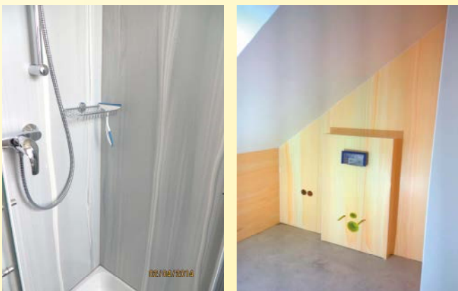
Über alte Fliesen oder im Neubau

Erhältlich in sämtlichen RAL-Farben und Marmorlook!