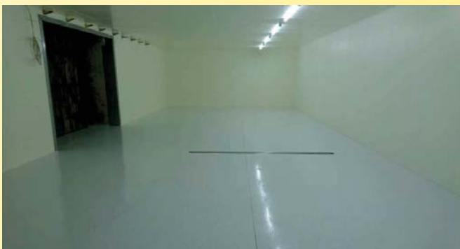
Lebensmittelreiner Raum entstand in ehemaligem Stall