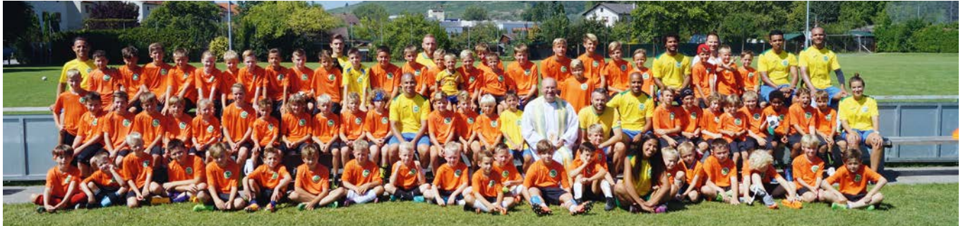
Pater Clemens zu Besuch beim Brasil Camps

Im fünften Jahr des Brasil Camps durften wir uns über einen Teilnehmerrekord freuen. Mehr als 70 Kinder genossen eine Woche lang brasilianisches Fußballflair im Stadion des S.C.M. Nicht nur die Kinder, sondern auch Eltern & Trainer durften sich im Spiel gegen die Brasil Trainer messen.