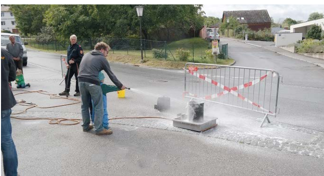
90 Jahr Feier